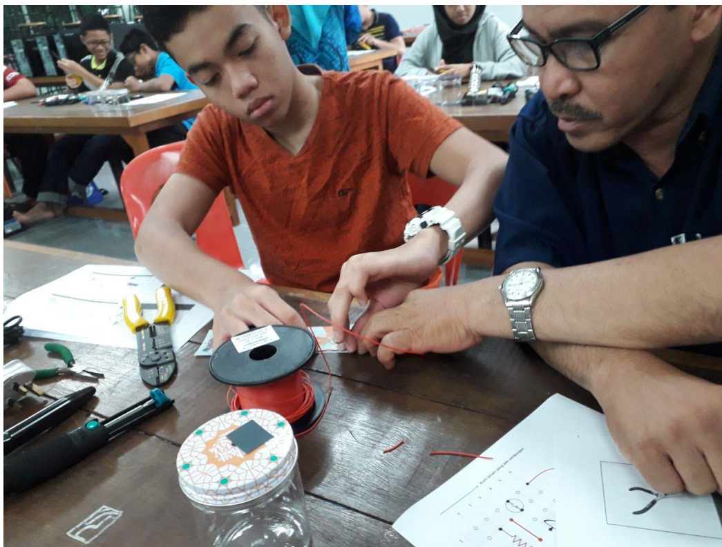
Peserta sedang memasang litar Pelita Raya.