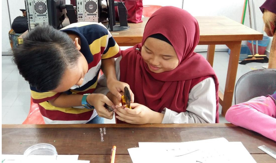
Peserta sedang memotong wayar penyambung