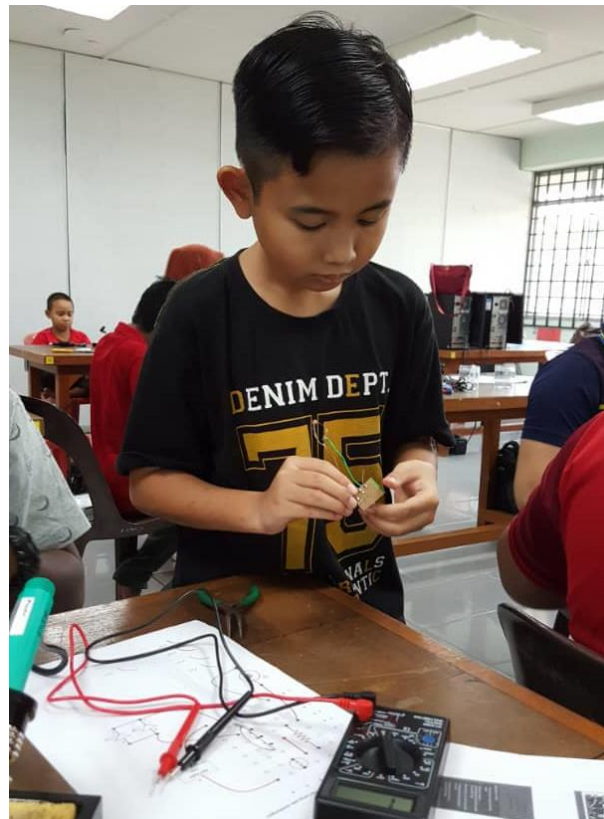
Peserta sedang menyiapkan litar Pelita Raya.