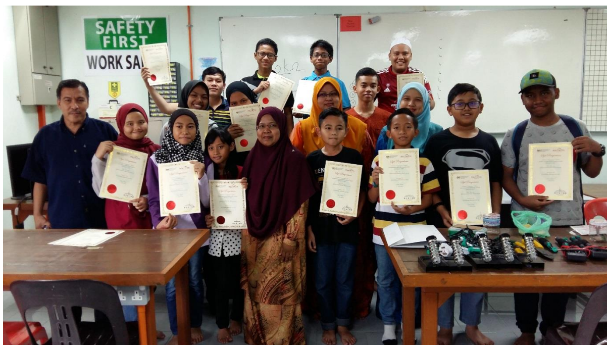
Peserta bergambar bersama penceramah dan fasilitator kursus.