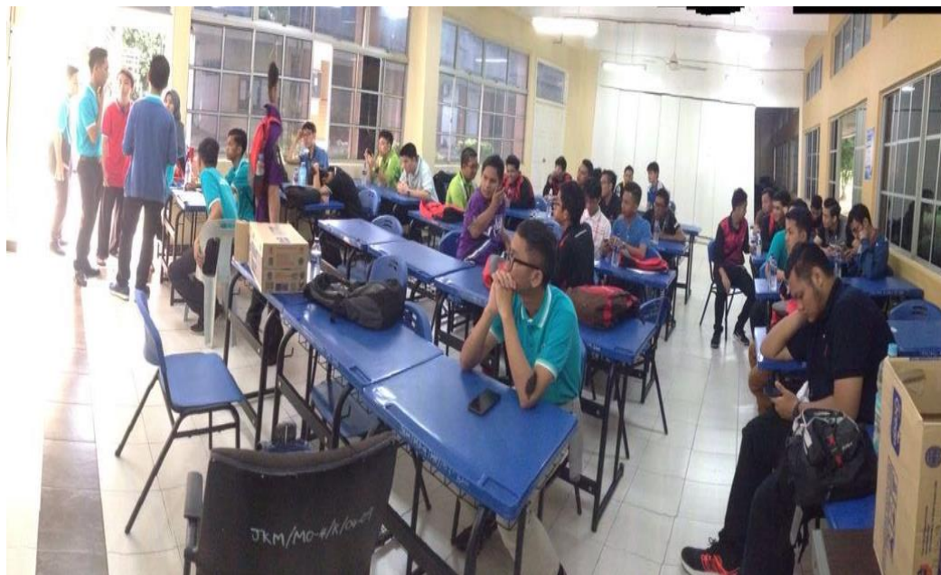
5.1 Sesi pendaftaran dan taklimat pelajar.