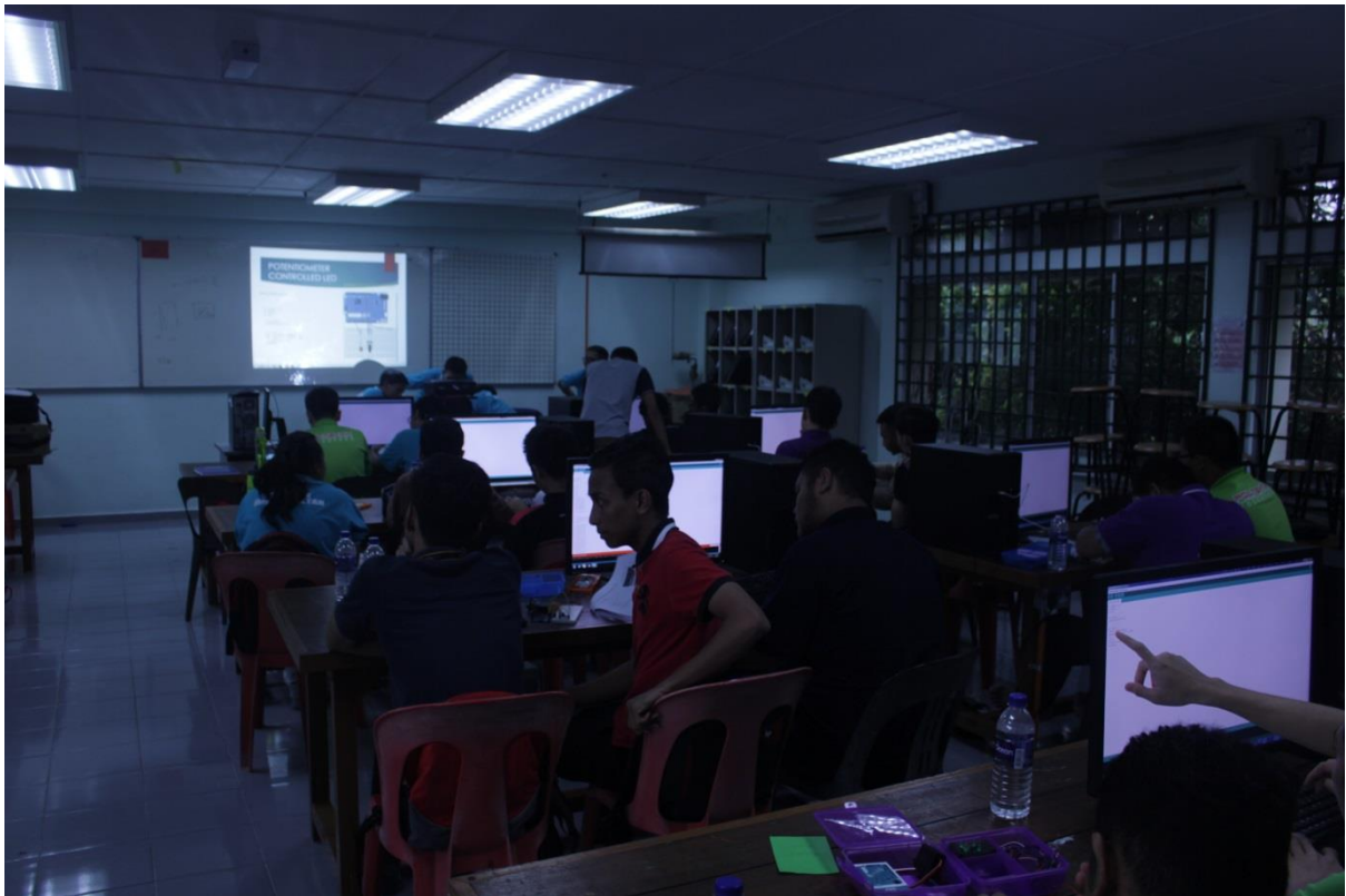
5.3 Sesi penerangan dan pembelajaran arduino