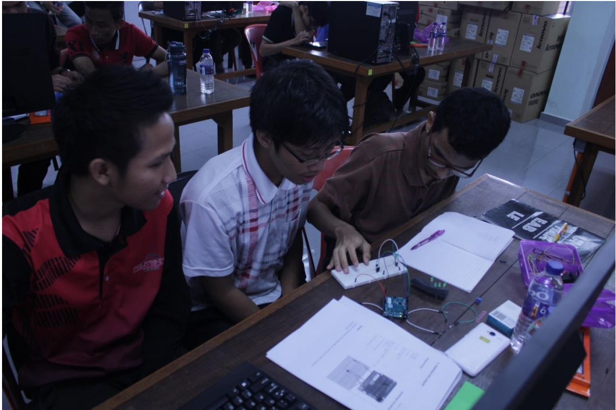
5.6 Penghasilan litar daripada ahli baru.