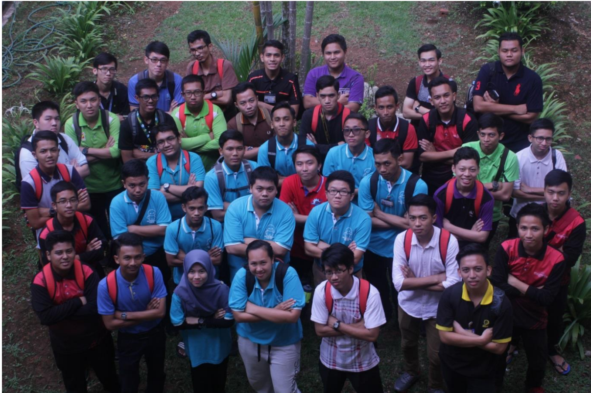
5.7 Majlis penutupan program arduino mega.