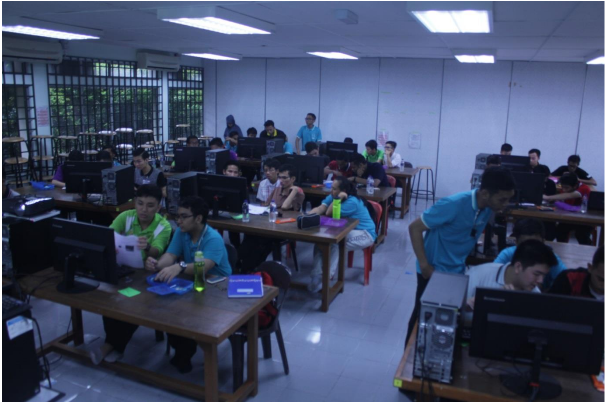
5.2 Sesi pembahagian pelajar.