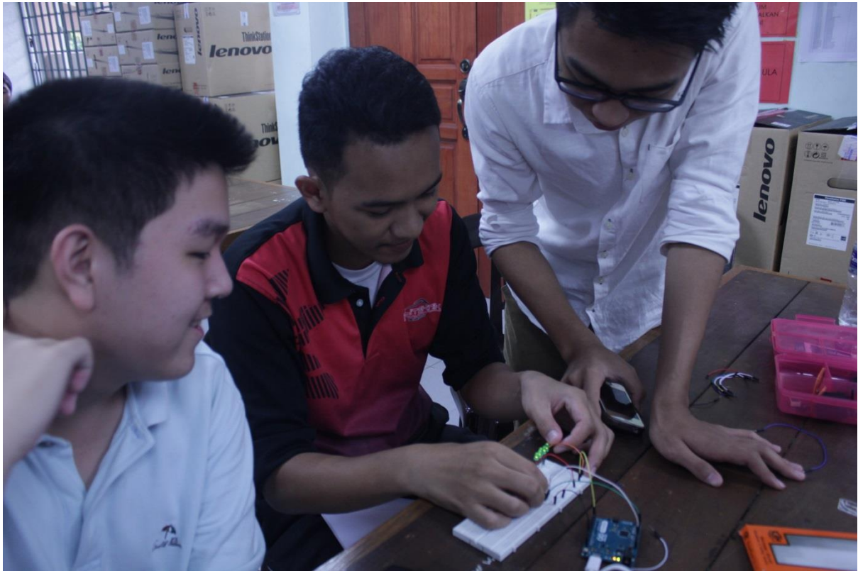
5.4 Antara kumpulan pelajar yang menghasilkan litar.