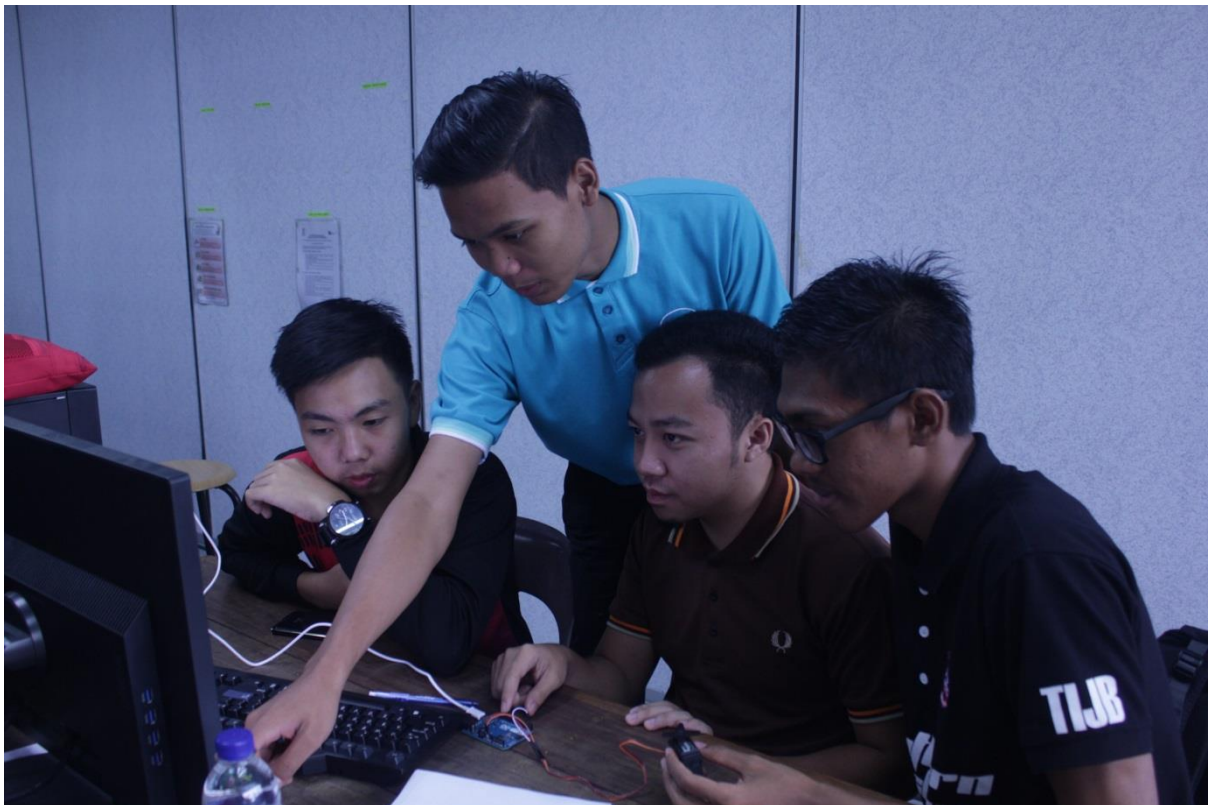
5.5 Antara penerangan mengenai program arduino.