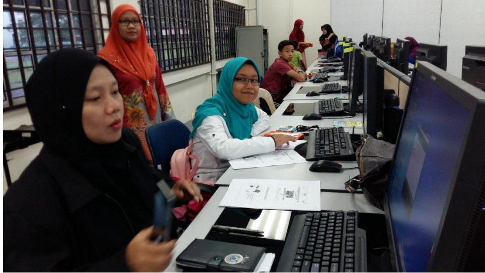
Peserta Kursus Arduino Uno for Beginner mengambil tempat masing-masing