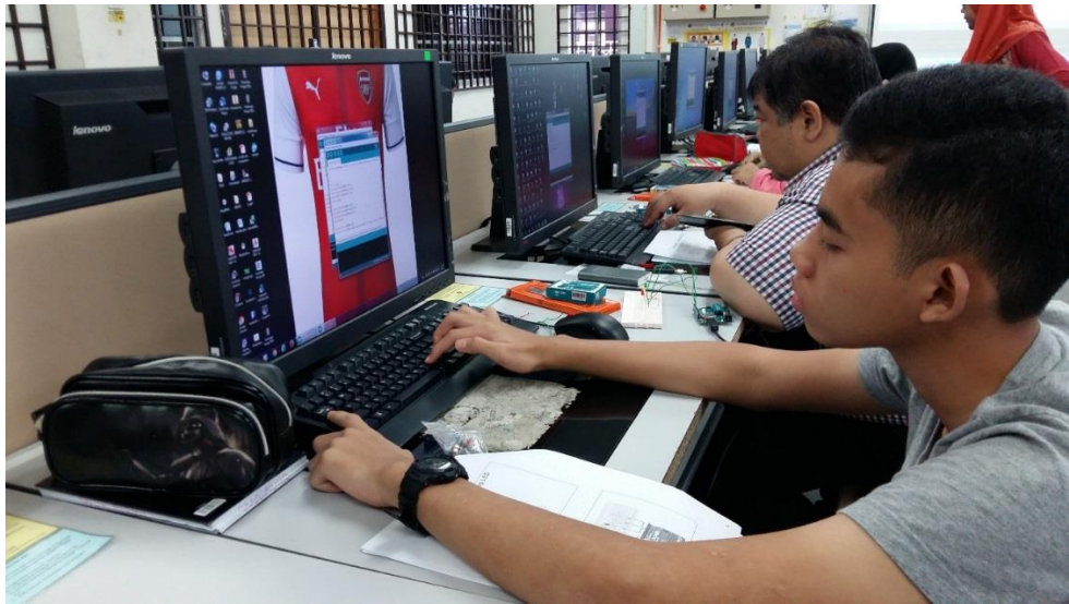
Peserta sedang membuat aturcara menggunakan perisian Arduino Uno