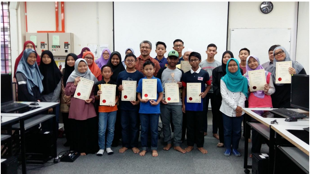
Para peserta Kursus Arduino Uno For Beginner bergambar bersama-sama penceramah, fasilitator dan Ketua Jabatan JKE