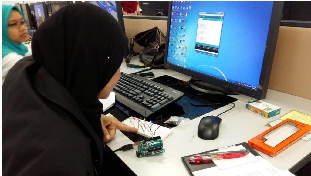
Peserta sedang menguji litar LED Blinking Forward/ Reverse Sequence