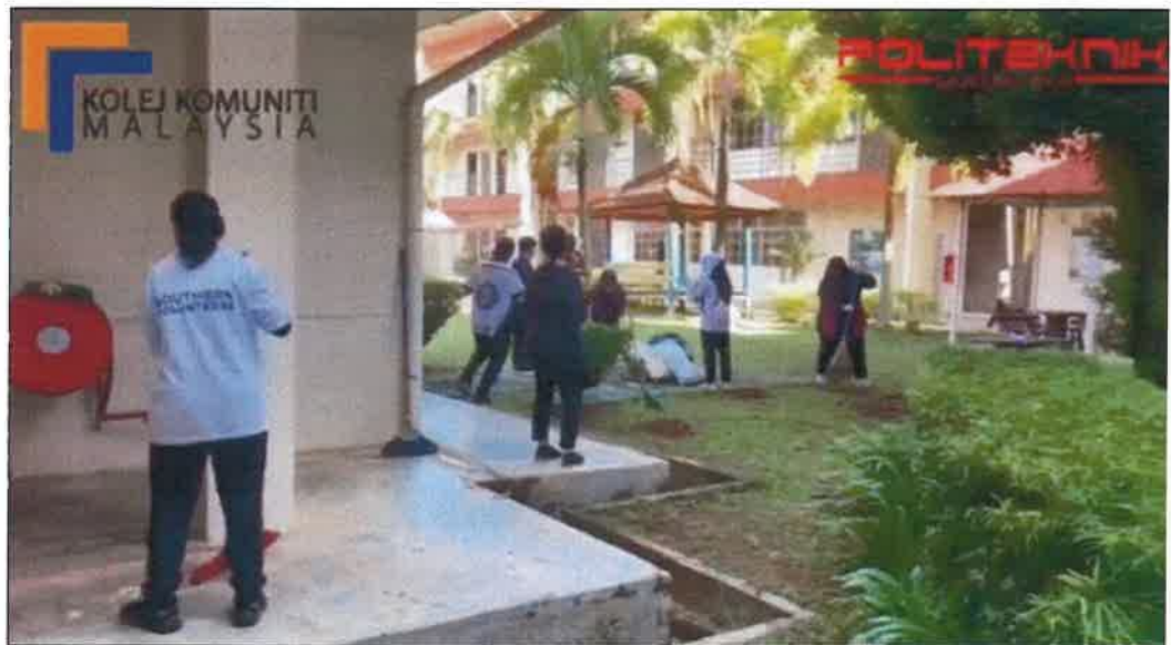
Gambar: Aktiviti pembersihan sekitar PIS