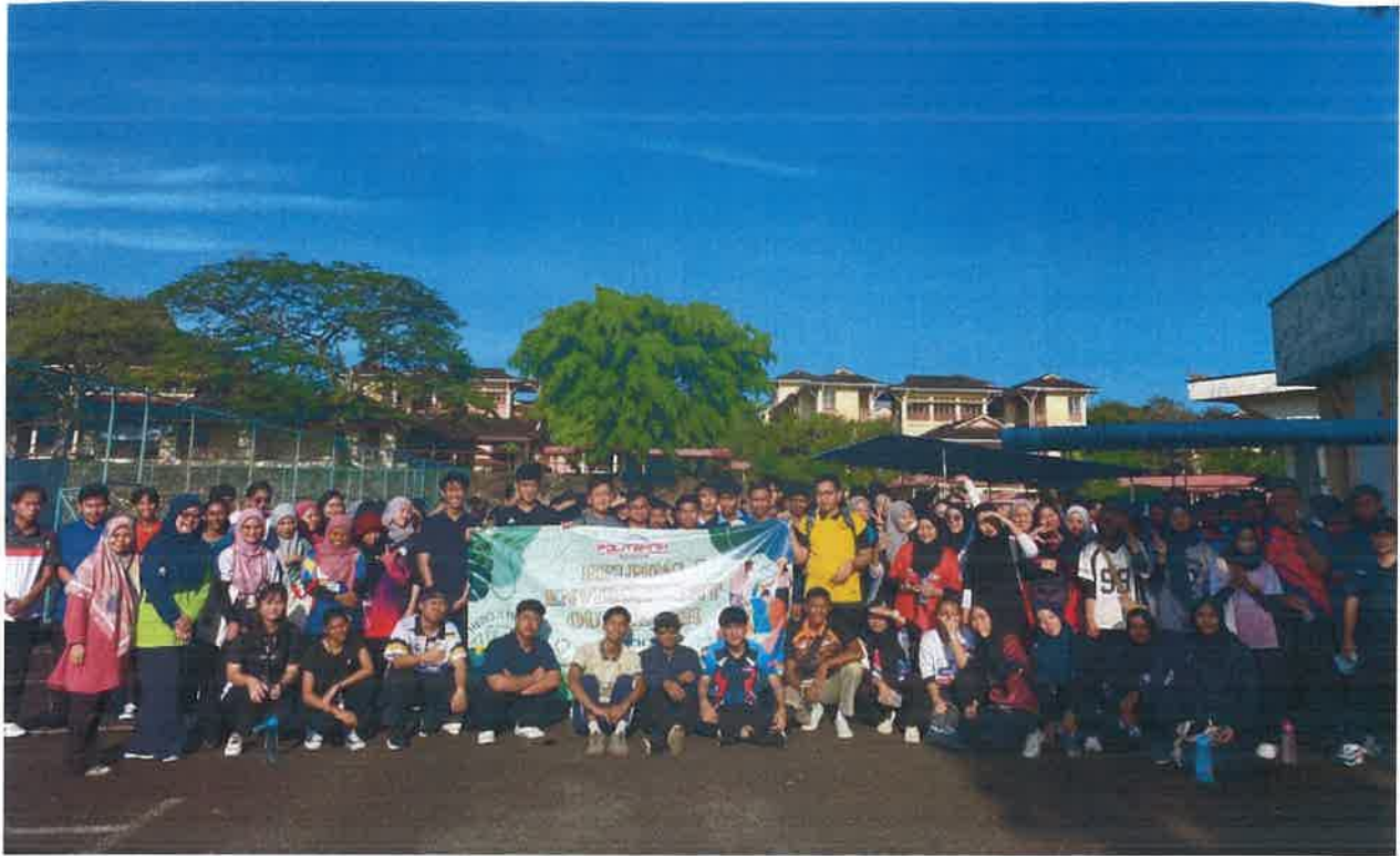
Gambar: Sebelum memulakan operasi pembersihan