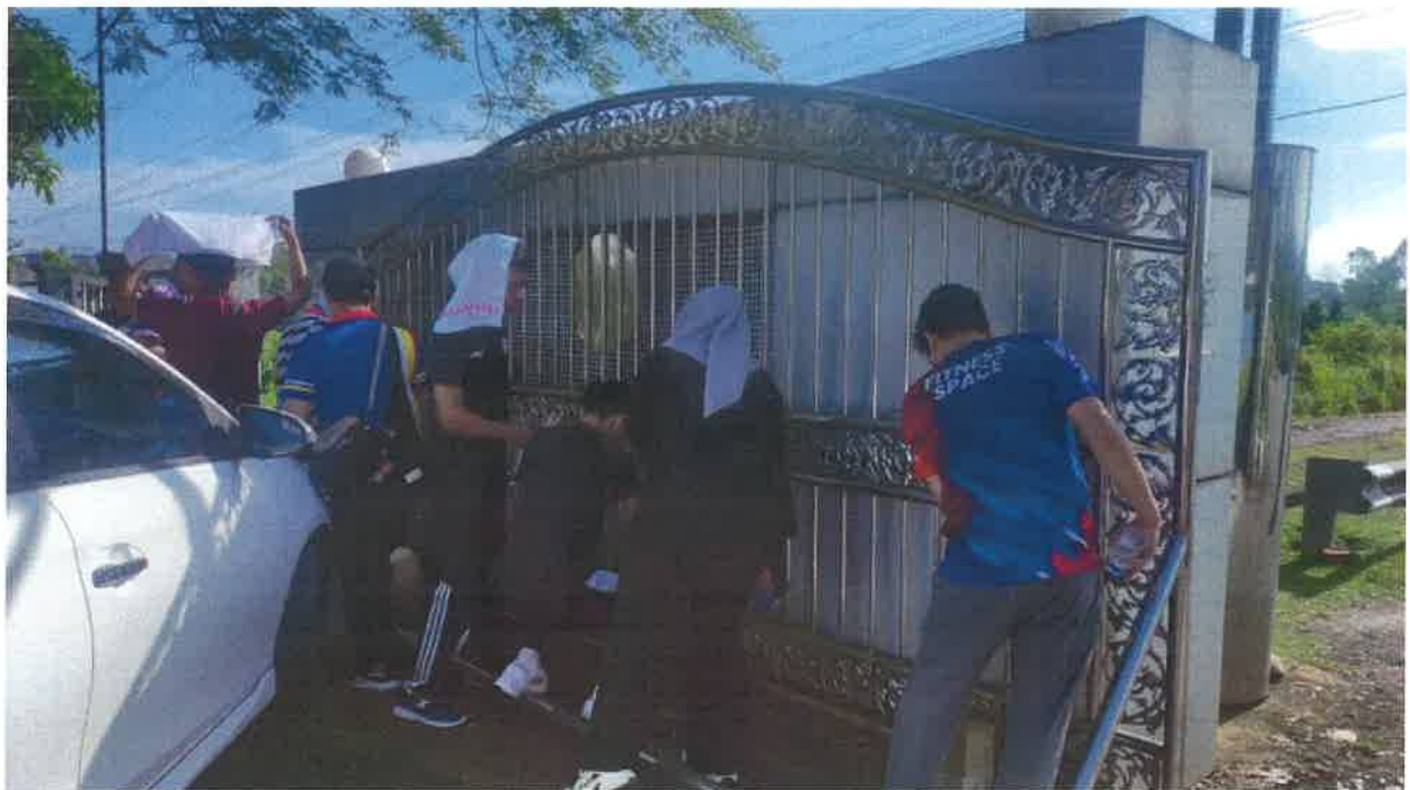
Gambar: Aktiviti pembersihan sekitar PIS