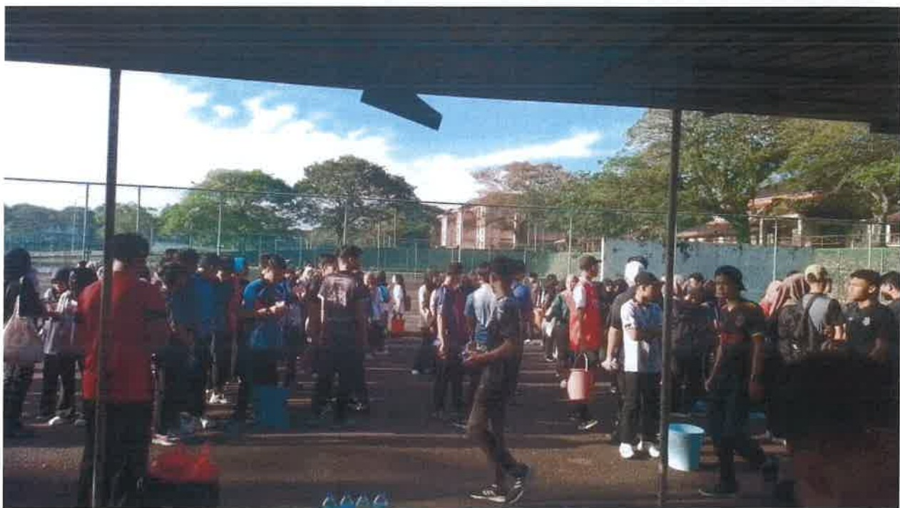
Gambar: Taklimat dah pembahagian kumpulan