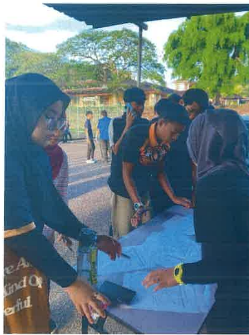
Gambar: Pendaftaran Pelajar